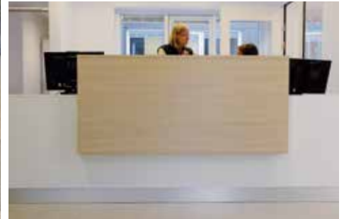
DESIGN OG HÅNDVÆRK