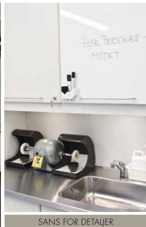
SANS FOR DETALJER

Climo tænker på alt – vores mål er at gøre dit arbejde lettere. Vi skaber plads til udstyr og implementerer daglige rutiner i enhver løsning. Vi gør dit arbejdsmiljø overskueligt og rationelt samtidig med, at det opretholder et æstetisk og stilrent ydre.