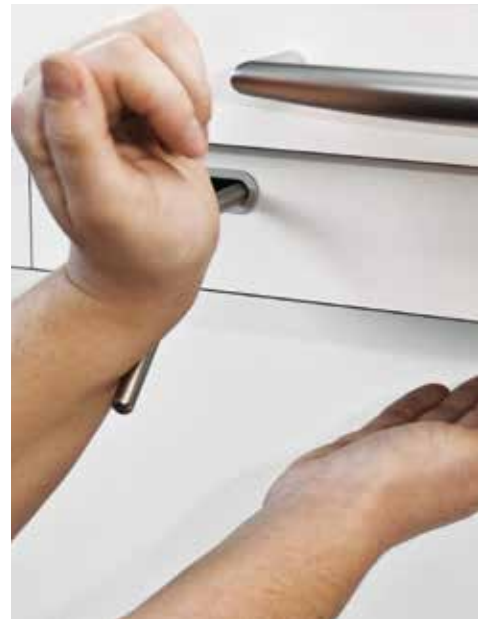
FUNKTIONEL OG ENKEL